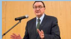
KIRCHE UND WIRTSCHAFT