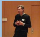
ENDE DER HIERARCHIE?!